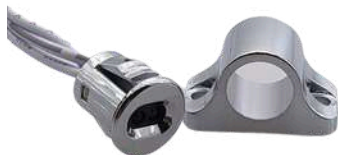
• SENSOR MANO ON-OFF+DIMMER • SENSOR PUERTA ON-OFF