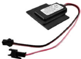
SENSOR DE TOQUE ON-OFF + DIMMER COD:5010250