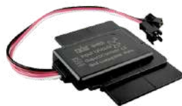
SENSOR DE PRESENCIA ON-OFF COD: 5010254