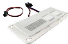
SENSOR DE TOQUE ON-OFF + DIMMER ANTIEMPAÑANTE RELOJ DE TIEMPO Y TEMPERATURA COD: 5010252