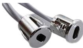
• SENSOR PUERTA DOBLE 12-24V