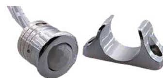
• SENSOR PROXIMIDAD PIR ON-OFF

Puede conectar varias fuentes en cascada, para replicar la señal del sensor de la primera fuente