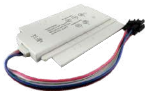
SENSOR DE TOQUE ON-OFF + DIMMER ANTIEMPAÑANTE COD: 5010251