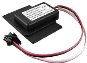
SENSOR DE MANO ON-OFF + DIMMER COD:5010253