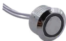
• SENSOR TOQUE ON-OFF + DIMMER