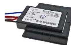
SENSOR DE TOQUE DOBLE BLANCO Y CALIDO ON-OFF + DIMMER COD: 5010220