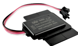
SENSOR DE PRESENCIA ON-OFF COD: 5010254