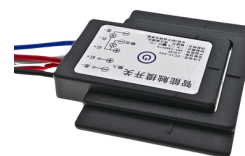
SENSOR DE TOQUE DOBLE BLANCO Y CALIDO ON-OFF + DIMMER COD: 5010220