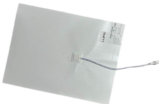
110V 30x40 cm COD:5010255