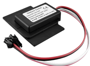
SENSOR DE MANO ON-OFF + DIMMER COD:5010253