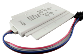
SENSOR DE TOQUE ON-OFF + DIMMER ANTIEMPAÑANTE COD: 5010251