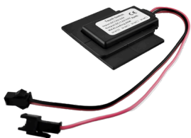
SENSOR DE TOQUE ON-OFF + DIMMER COD:5010250