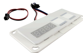
SENSOR DE TOQUE ON-OFF + DIMMER ANTIEMPAÑANTE RELOJ DE TIEMPO Y TEMPERATURA COD: 5010252